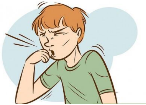
عطسه و سرفه های شدید

علائم کرونا مانند سرماخوردگی و آنفولانزا است و نمی‌توان علائم خاصی اعلام کرد، اما باید توجه شود که افراد پرخطر مانند خانم باردار، بیماران قلبی عروقی، افرادی که پیوند اعضا داشتند یا دارای بیماری نارسایی اعضا هستند، افراد بالای ۶۵ سال، افراد دارای سرطان تحت درمان در معرض خطر بیشتری قرار دارند. این دسته از افراد در صورت مشاهده علائم زیر حتماً به مراکز درمانی مراجعه کنند.